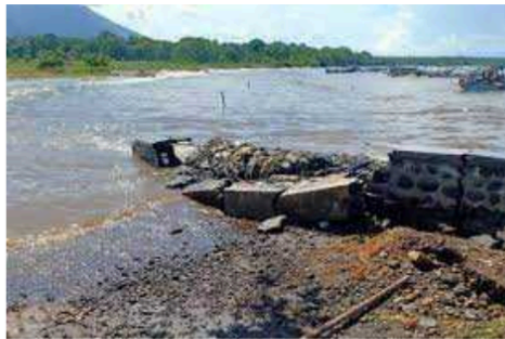
Gambar 1. Kerusakan Bangunan Tanggul Laut ( Sea dikes )

Permasalahan lingkungan pesisir di Indonesia seperti abrasi, erosi dan banjir rob menjadi salah satu tugas besar bagi pemerintah dan masyarakat karena mengancam pemukiman warga. Permasalahan erosi pantai seringkali menimbulkan dampak buruk terhadap pemukiman serta mengganggu wilayah pantai, hal ini dapat dicegah salah satunya dengan membuat bangunan pantai di laut [1]. Adapun wilayah yang seringkali diterjang gelombang tinggi, erosi dan abrasi pantai saat musim hujan deras yakni dusun Laok Bindung, Situbondo, Jawa Timur.