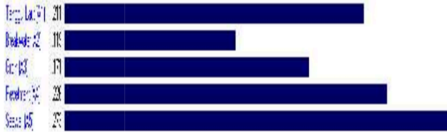
Gambar 4. Hasil Perangkingan Alternatif Tipe Bangunan Pantai

Dari gambar 4 menunjukkan bahwa hasil perangkingan alternatif dengan metode expert choice adalah Seawall berbobot 0,273 menjadi prioritas utama tipe alternatif bangunan pantai. Seawall merupakan struktur yang dibangun guna mencegah abrasi gelombang laut dan erosi pantai. Seawall dapat mengurangi dampak langsung gelombang yang merusak pantai sehingga menjaga keamanan pantai. Struktur seawall dapat membantu menjaga kestabilan dengan cara meredam energi gelombang dan erosi tanah.