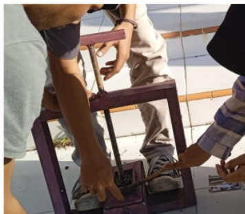
Gambar 3. Posisi cetakan paving setelah semua adonan dituang