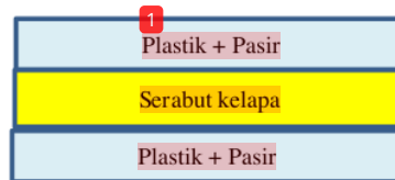
Gambar 1. Posisi Matriks dan Filler dalam cetakan

Adapun komposisi paving mengikuti penelitian sebelumnya(Listriyana & Silviyanti, 2023) dengan komposisi 771,6 gram plastik : 1800,4 gram pasir : 11 gram serabut kelapa dengan peletakan serabut di tengah cetakan.