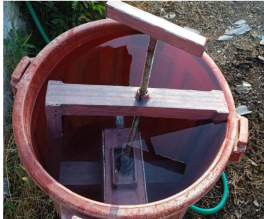
Gambar 4. Posisi perendaman cetakan paving berisi adonan paving

Setelah keluar dari cetakan, paving didiamkan selama 30 menit, di timbang kemudian menuju ke tahap selanjutnya yaitu tahap perendaman