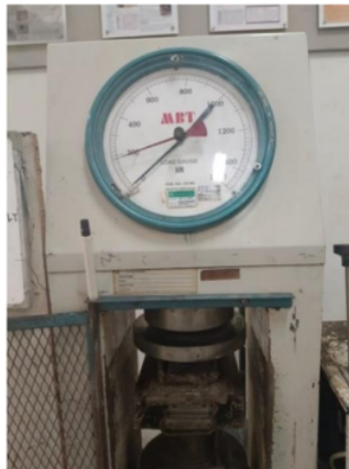
Gambar 4. Proses Pengujian Tekan dengan Mesin UTM

Uji tekan dilakukan untuk melihat kekuatan tekan dan plasbut paving block yang telah dibuat