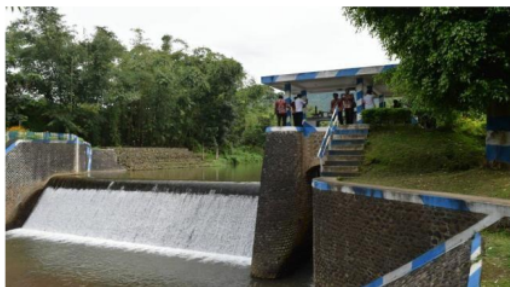
Gambar 1. Waduk Bina Marga SDA Kabupaten Bondowoso Tahun 2022

pandai dalam melaksanakan pekerjaannya. Sedangkan dari luar instansi atau instansi, pegawai juga mendapat dukungan moril dari keluarga dan teman dekat, yang intinya semangat kerja ini untuk memotivasi pegawai agar menyelesaikan pekerjaannya tepat waktu yang ditentukan oleh instansi atau instansi tersebut.