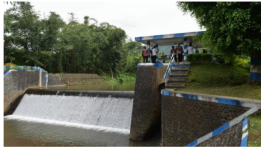
Gambar 1. Waduk Bina Marga SDA Kabupaten Bondowoso Tahun 2022

pandai dalam melaksanakan pekerjaannya. Sedangkan dari luar instansi atau instansi, pegawai juga mendapat dukungan moril dari keluarga dan teman dekat, yang intinya semangat kerja ini untuk memotivasi pegawai agar menyelesaikan pekerjaannya tepat waktu yang ditentukan oleh instansi atau instansi tersebut.