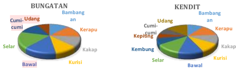
Gambar 2. Prioritas Komoditas Ikan Di Kecamatan Besuki dan Mlandingan

Bungatan dan Kendit memiliki jumlah basis yang lebih banyak dibandingkan kecamatan lainnya. Untuk Kecamatan Bungatan terdiri dari ikan bawal, selar, kurisi, kerapu,