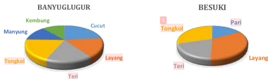
Gambar 1. Prioritas Komoditas Ikan Di Kecamatan Banyuglugur dan Besuki

Angka Location Quotient (LQ) untuk Kecamatan Banyuglugur menunjukkan angka prioritas untuk jenis ikan kembung, cucut, manyung, tongkol, layang dan teri. 6 jenis komoditas ini merupakan basis di Kabupaten Situbondo (nilai LQ > 1 ). Kecamatan Besuki memiliki prioritas 4 jenis ikan dengan LQ > 1 yaitu ikan layang, teri, tongkol dan pari.