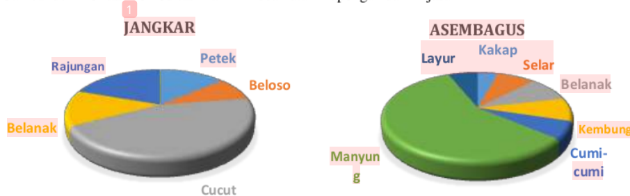
Gambar 5. Prioritas Komoditas Ikan Di Kecamatan Kapongan dan Arjasa

Kecamatan Kapongan yang bersebelahan dengan Kecamatan Mangaran juga memiliki cukup banyak jenis ikan yang dapat diibandingkan, diantaranya adalah ikan lemuru, rajungan, kepiting, cumi, layur, bambangan, kerapu, kurisi, bawal, selar, dan belanak. Sementara di Kecamatan Arjasa hanya ada 5 jenis ikan dengan LQ>1 yaitu ikan kakap, kurisi, cumi, bambangan dan kerapu. Ke wilayah timur yaitu Kecamatan Jangkar,