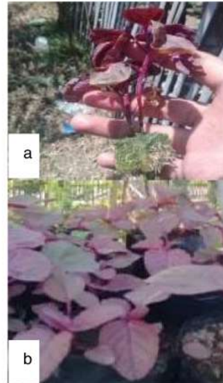
Gambar 3. Pertumbuhan bayam merah Metode Hidroponik (a) dan konvensional (b) setelah berumur 4 minggu

Setelah biji disemai, kemudian bibit yang sudah siap atau telah memiliki 4 daun dapat dipindahkan ke media tanam yang lebih besar. Benih yang disemai dengan media tanam rockwool dipindahkan kedalam sistem hidroponik.