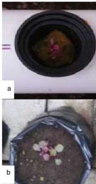
Gambar 2. Pertumbuhan bayam merah Metode Hidroponik (a) dan konvensional (b) setelah berumur 2 minggu

Setelah biji disemai, kemudian bibit yang sudah siap atau telah memiliki 4 daun dapat dipindahkan ke media tanam yang lebih besar. Benih yang disemai dengan media tanam rockwool dipindahkan kedalam sistem hidroponik.