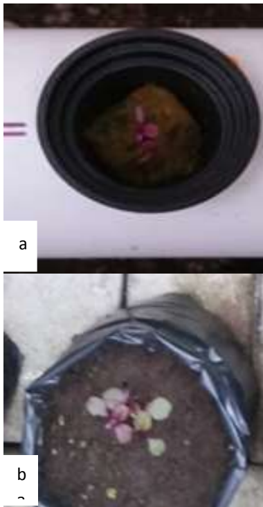
Gambar 2. Pertumbuhan bayam merah Metode Hidroponik (a) dan konvensional (b) setelah berumur 2 minggu

Setelah biji disemai, kemudian bibit yang sudah siap atau telah memiliki 4 daun dapat dipindahkan ke media tanam yang lebih besar. Benih yang disemai dengan media tanam rockwool dipindahkan kedalam sistem hidroponik.