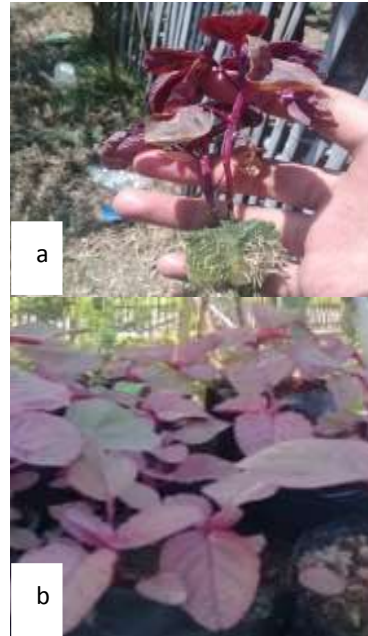
Gambar 3. Pertumbuhan bayam merah Metode Hidroponik (a) dan konvensional (b) setelah berumur 4 minggu

Setelah biji disemai, kemudian bibit yang sudah siap atau telah memiliki 4 daun dapat dipindahkan ke media tanam yang lebih besar. Benih yang disemai dengan media tanam rockwool dipindahkan kedalam sistem hidroponik.