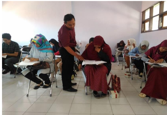
Gambar 4. Sesi Praktik