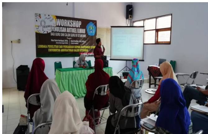
Gambar 2. Pemberian Materi 1

Sesi ini diawali dengan pemberian materi mengenali konsep dan prosedur penulisan artikel ilmiah. Peserta diperkenalkan dengan kerangka umum artikel ilmiah, yaitu: latar belakang, tinjauan pustaka, metode penelitian, hasil dan pembahasan, dan kesimpulan dan saran. Peserta dibekali pengetahuan tentang apa yang harus mereka tulis dalam bagian-bagian artikel tersebut. Disampaikan pula kepada peserta bahwa artikel ilmiah berasal dari kegiatan penelitian yang telah dilakukan oleh peserta. Artikel ilmiah juga dapat berupa hasil pemikiran konseptual. Dikarenakan semua peserta pelatihan adalah guru, maka peserta diwajibkan memiliki pemahaman yang cukup tentang penelitian pendidikan, utamanya Penelitian Tindakan Kelas (PTK). Pada sesi ini ditemukan fakta bahwa peserta merasa kesulitan dalam mengerjakan tinjauan pustaka. Hal ini dikarenakan kebiasaan membaca yang rendah. Selain itu, beberapa peserta beralasan tidak adanya referensi membuat mereka kesulitan menyusun artikel ilmiah. Maka dari itu, kami memberikan beberapa alternatif untuk masalah ini seperti memberikan alamat-alamat website jurnal pendidikan, menunjukkan beberapa judul buku metode penelitian, dan membagikan beberapa contoh artikel penelitian pendidikan. Diharapkan peserta mendapatkan pencerahan dari sumber-sumber tersebut.