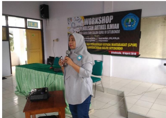
Gambar 5. Sesi Evaluasi