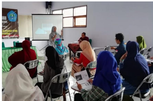
Gambar 3. Pemberian Materi 2

Jika dirangkum, secara umum, permasalahan yang ditemukan selama sesi pemberian materi adalah sebagai berikut: