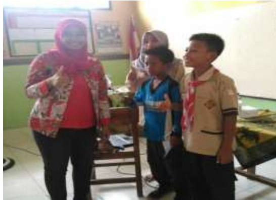
Gambar 5. Diskusi 1