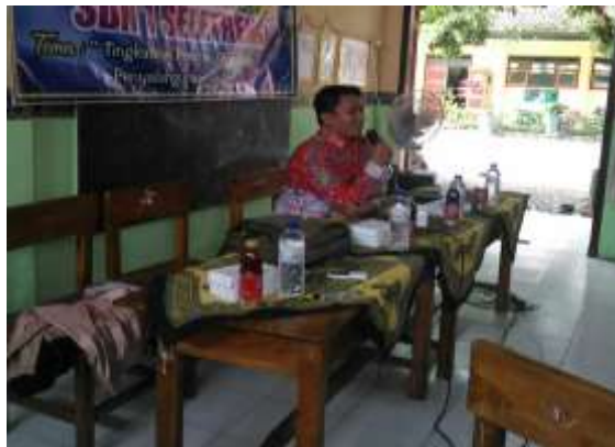
Gambar 6. Diskusi 2