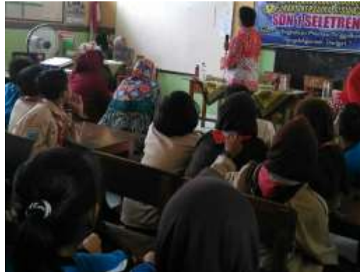
Gambar 4. Pemberian Materi 2