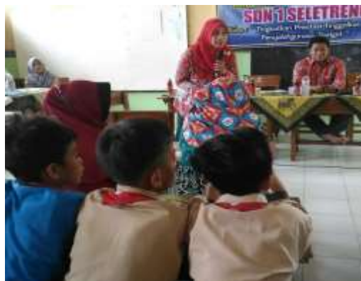
Gambar 3. Pemberian Materi 1