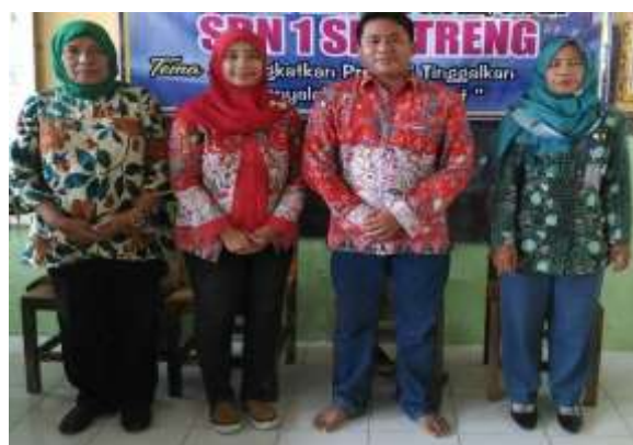
Gambar 7. Foto bersama Guru SD Negeri 1 Seletreng