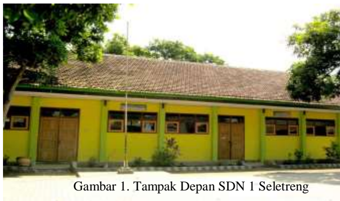
Gambar 1. Tampak Depan SDN 1 Seletreng

SDN 1 Seletreng beralamat di Jl. PP Sumber Bunga, RT.0/RW.0. Pademin, Seletreng, Kapongan, Situbondo. Sekolah ini dipimpin oleh Hj. Hasanah, M.Pd. selaku kepala sekolah. Sekolah ini terakreditasi B, memiliki total sembilan guru dan delapan puluh dua siswa (Data Pokok Pendidikan Dasar dan Menegah, 2020).