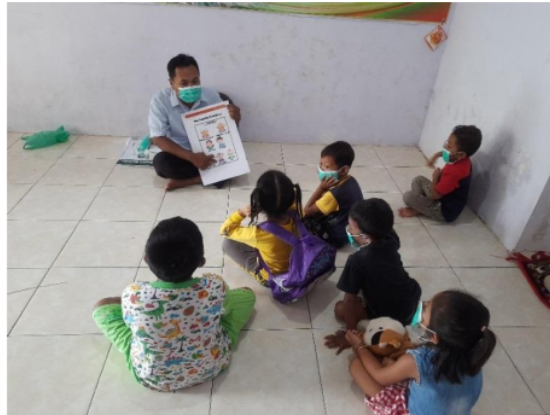
43 Gambar 1. Uji Coba 1