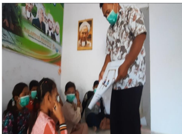
Gambar 4. Uji Coba 3