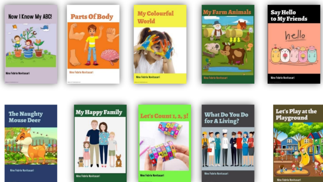
Gambar 2. Set Big Book

halam buku dan ilustrasi sampul buku. Proses ilustrasi dilakukan secara digital menggunakan software online yaitu postermymwall . Setelah itu, tahap terakhir dari proses pembuatan produk adalah penyusunan petunjuk kegiatan bagi guru. Petunjuk ini dibuat dengan tujuan memberikan alternatif cara mengajarkan kosakata kepada siswa menggunakan big book. Berikut big book yang telah dikembangkan.