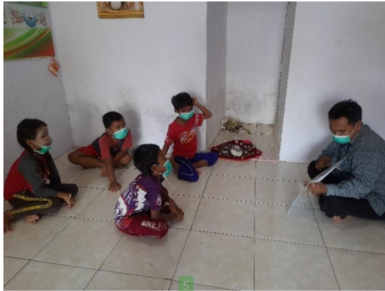
Gambar 3. Uji Coba 2