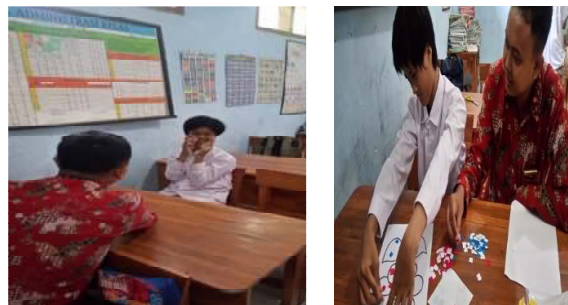
Gambar 2. Kegiatan saat pelatihan dan pendampingan