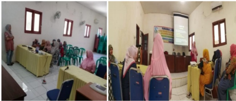
Gambar 2. Narasumber Memberikan Materi