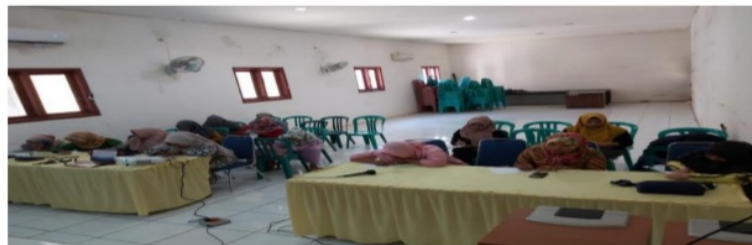
Gambar 3. Peserta dalam kegiatan pelatihan

Implementasi dari hasil pelatihan yang sudah dipelajari pada hari sebelumnya, selanjutnya di implementasikan dalam bentuk praktek, para peserta wajib membawa laptop ketika pelaksanaan kegiatan. Pada kegiatan praktek masih banyak peserta yang kebingungan dalam langkah pembuatan media audio visual. Waktu yang telah direncanakan pada kegiatan penerapan berjalan sesuai dengan jadwal yang sudah disepakati pada awal kegiatan, bahkan peserta meminta perpajangan waktu. Setelah kegiatan pelatihan ini peserta diminta untuk mengirim hasil prakteknya kepada tim pelaksana, yang nantinya akan menjadi bahan evaluasi oleh tim pengabdian. Pendampingan dalam pembuatan media audio visual.