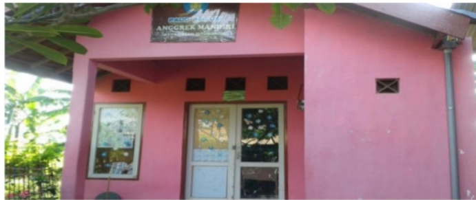
Gambar1. PAUD Inklusi