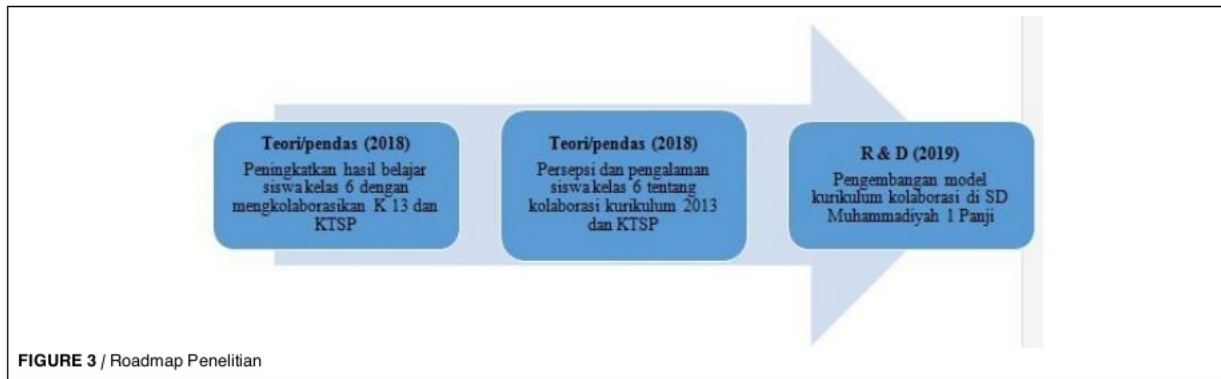
FIGURE 3 / Roadmap Penelitian