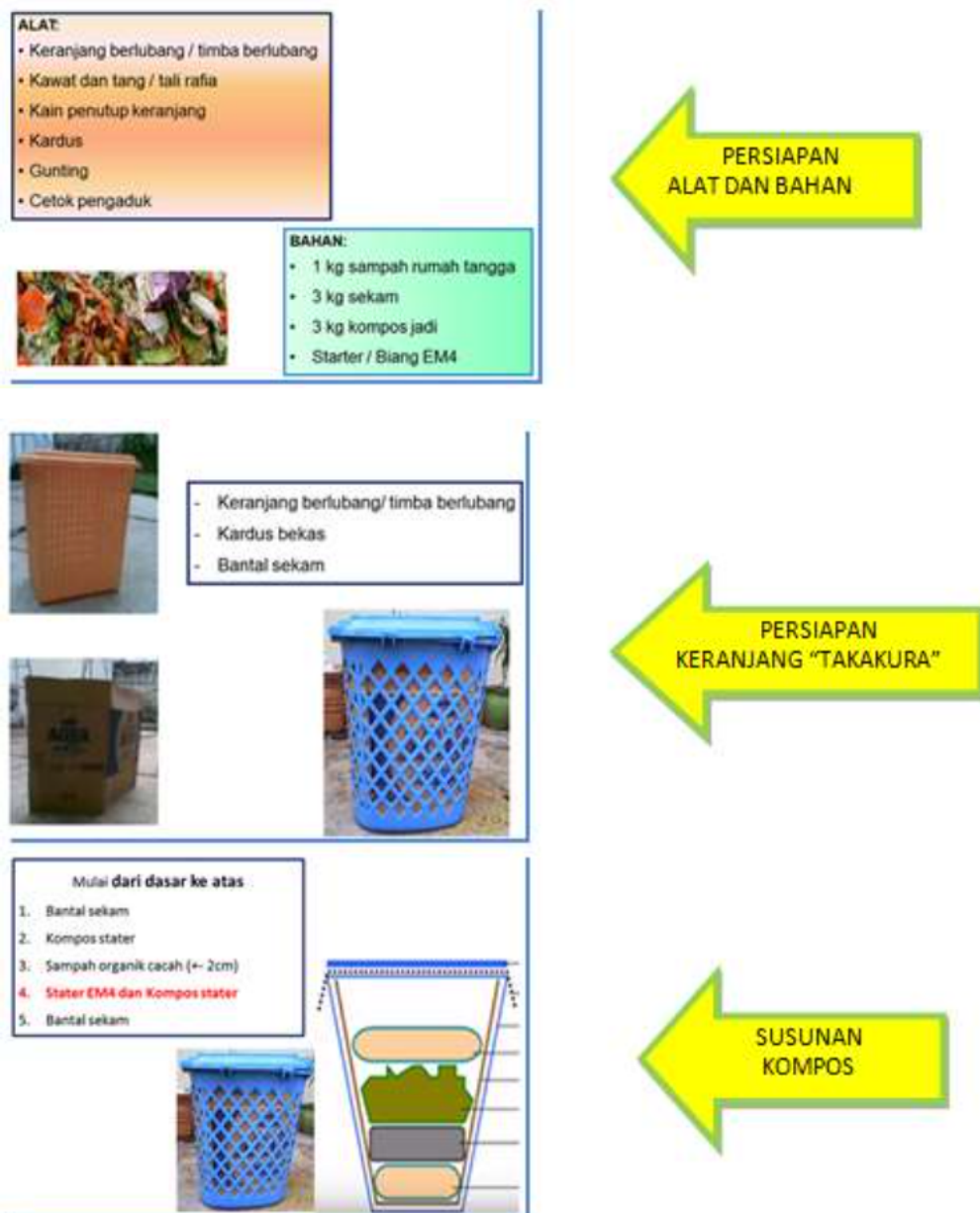
Gambar 2 Langkah membuat kompos “Takakura”

dasar sampah rumah tangga. Gambar 2 berikut merupakan langkah membuat kompos dengan aplikasi teknologi tepat guna “Takakura” sampah organik rumah tangga.