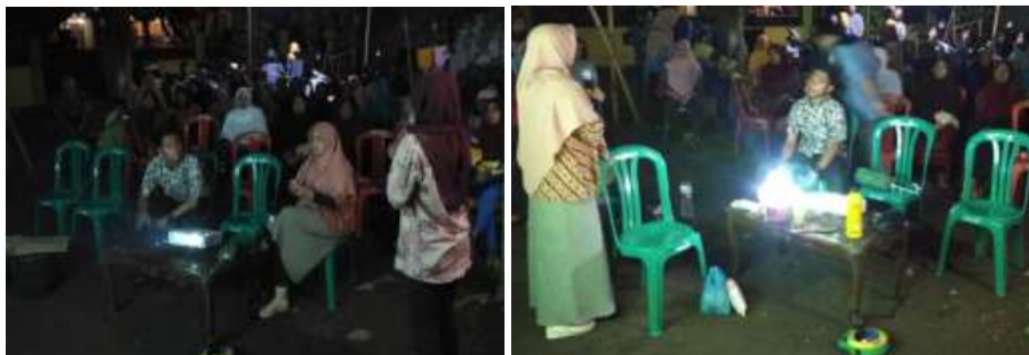
Gambar 3. Demonstrasi dan pendampingan pembuatan kompos TAKAKURA

Pelatihan ketiga, kegiatan ini merupakan evaluasi terakhir dan pengecekan keberhasilan pembuatan kompos dalam keranjang “Takakura”. Pada pertemuan ketiga disampaikan pula beberapa ciri dan faktor penyebab tidak berhasilnya pembuatan pupuk kompos. Serta memberikan motivasi pada mitra agar kegiatan ini bisa dijadikan kegiatan berkelanjutan di lingkungan rumah tangga dalam kehidupan sehari-hari.